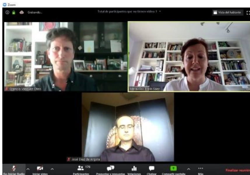
Acto online 5 de mayo de 2020

https://www.youtube.com/watch?v=L8paeb3MkdY&ab_channel=ObservatoriodeRSCObservatoriodeRSC